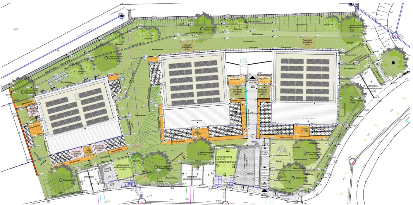
Außenanlagen- und Grünflächenplan

Durch eine im Kaufvertrag formulierte Bauverpflichtung wurde das städtebauliche Konzept der Planung, der Holzbau-Anteil sowie ein hoher Grünflächenanteil bei der Herstellung gesichert.