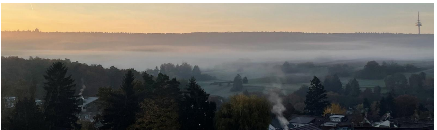
Rundumansicht von den Projektgrundstücken auf den Naturparkschönbuch

Die bezugsfertige Realisierung für den Investor wurde vertraglich zum 31.12.2030 festgelegt.